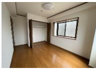
※写真はB201号室となります。