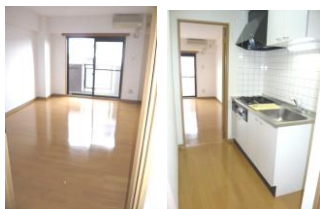
※室内写真は502号室となります。

*今回募集* 402号室 返去済 家賃: 58,000円 管理費: 5,000円 償却負担金: 880円 (即入居可) 1K...使用部分面積29.75㎡