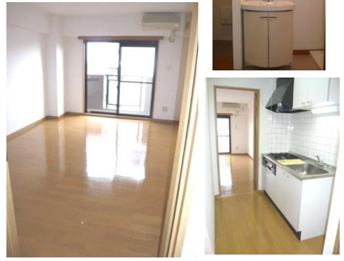
※室内写真は502号室となります。