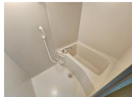
※室内写真は305号室となります。

*今回募集* 605号室 退去済 家賃：66,000円 管理費：4,000円 緊急メンテ費：700円 (即入居可) 使用部分面積：34.10㎡