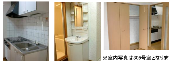
※室内写真は305号室となります。