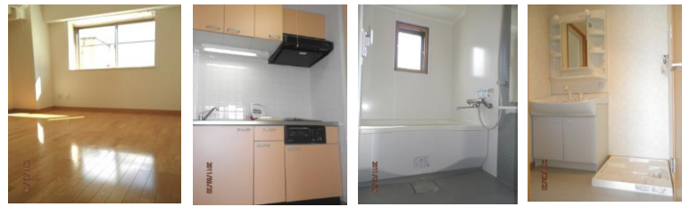
※室内写真は5号室となります。

205号室 退去済 家賃：63,000円 管理費：4,000円 メンテ保証料：600円 (緊急メンテ含む) (即入居可) 使用部分面積：27.00㎡