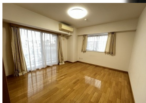
※室内写真は405号室となります。