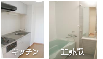
※室内写真は1008号室となります。