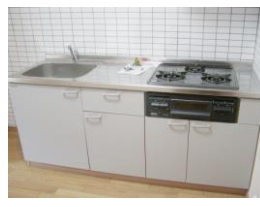
※室内写真は203号室のため反転となります。

今回募集 102号室 退去済 家賃：69,000円 管理費：3,000円 メンテ保証料：600円 (緊急修理含む) (リフォーム中・1/末入居可予定) 使用部分面積：56.70㎡