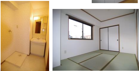
※室内写真は101号室のため、反転となります。