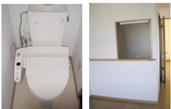
※室内写真は2号室が17となります。