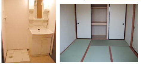
※室内写真は、2DKタイプ