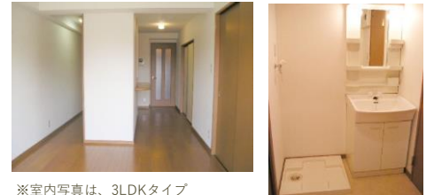
※室内写真は、3LDKタイプ