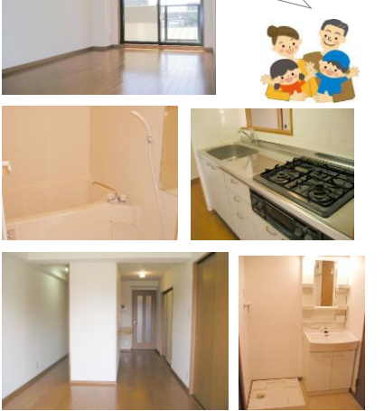
※室内写真は、3LDKタイプ